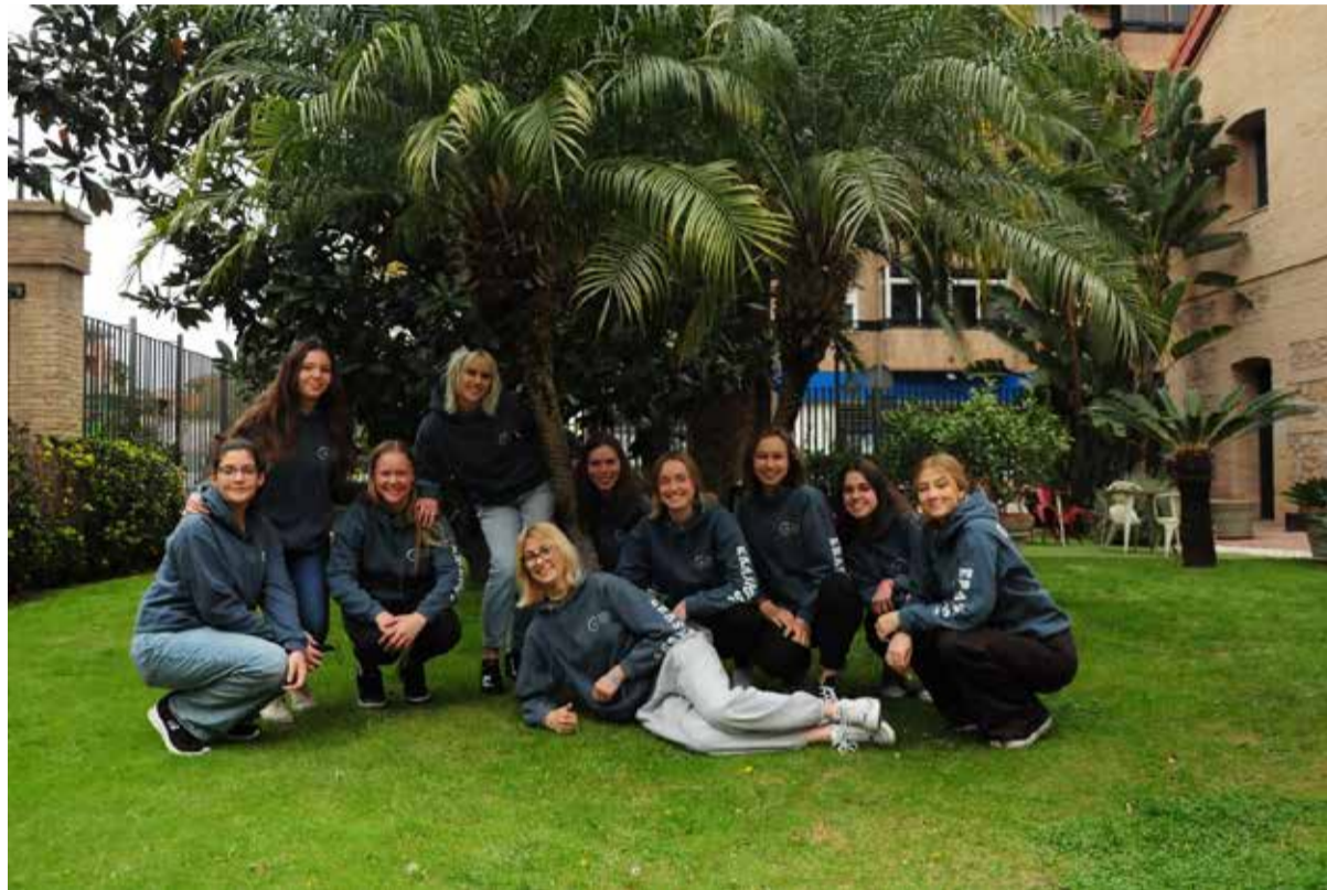
Dekleta pred vrtcem v Valenciji

V prvih treh dneh smo dijakinje obiskale dva dvojezična vrtca (zasebnega in javnega), v katerih so nas vzgojiteljice razdelile v skupine. Prvi dan smo dogajanje v vrtcih bolj opazovale, v naslednjih dneh pa smo se vključile v rutino vrtca, ki je precej podobna slovenski. Otroci se ob prihodu v vrtec prosto igrajo, sledijo malica, jutranji krog, vodena dejavnost, kosilo in počitek. Otroci imajo nekakšne uniforme, hrano in pijačo za malico pa nosijo od doma. Vrtca sta na nas naredila pozitiven vtis. Najbolj nam je bil všeč barvit in razgiban izgled igralnice in pa poudarek, ki so ga vzgojiteljice dale na glasbo. Ta je bila namreč vedno prisotna, ob glasbi smo peli, plesali, s preprostimi pesmicami so vzgojiteljice otroke tudi motivirale, npr. za vodeno