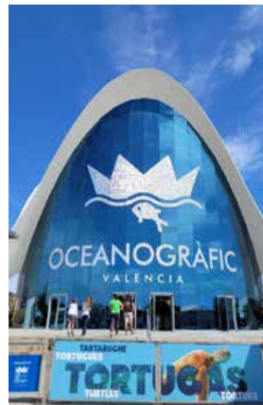
Akvarij v Valenciji

znanosti in umetnosti, ki ga je zasnoval arhitekt Santiago Calatrava in je prava paša za oči ter nudi vrsto aktivnosti. Tu se nahajajo opera, interaktivni muzej znanosti, največji akvarij v Evropi – Oceanografic in kinematograf Hemisferic . Celotno področje je postavljeno ob reko Turijo, ki so jo v zgodovini zaradi poplav preusmerili iz mesta, v njeni suhi strugi pa zasadili parke in uredili površine za rekreacijo. Oceanografic nudi dom več kot 45.000 živalim, od tega 500 različnim vrstam. V akvariju se zavedajo pomena ekologije in opozarjajo