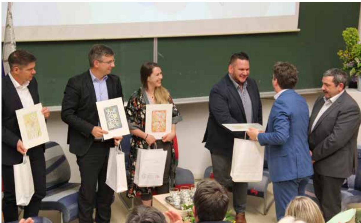
Zahvala udeležencem in podelitev grafičnih listov

Četrta okrogla miza z gospodarstveniki in znanstveniki