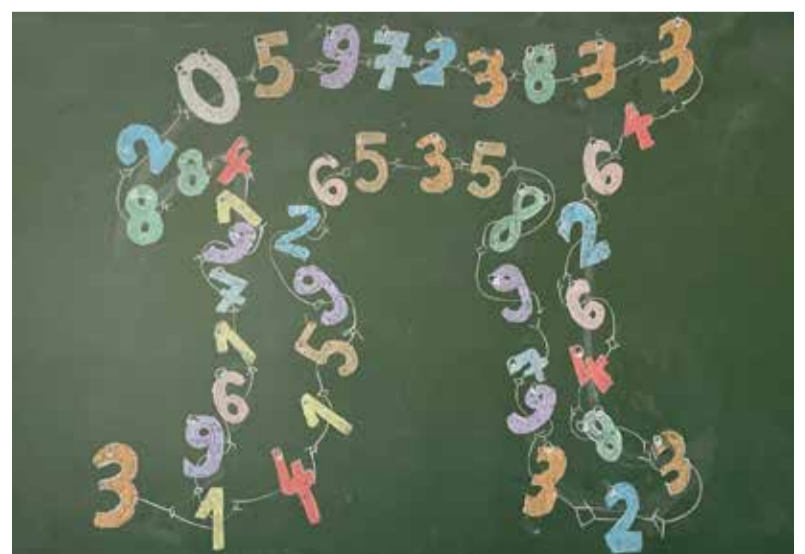
Risba na tabli v 4. č, arhiv šole.