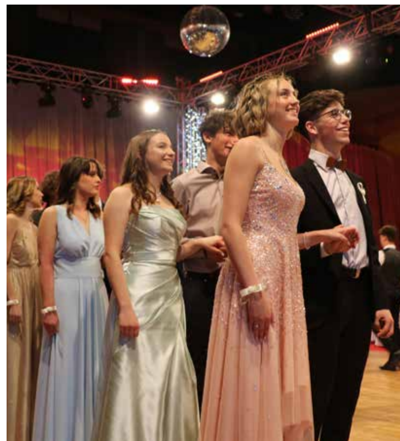
Maturantski ples 2022.